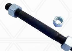
Prisioneiro Longo Inferior Ø1.1/2x350