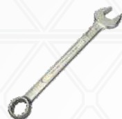
Chave combinada 15/16"

Para andaime devido aos travamentos internos em tubo 48mm.