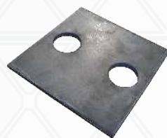
CHAPA 1/4X150X150MM (contra Flecha)