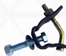
Meia Braçadeira para tubo Ø48mm