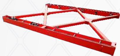
Treliça MX215X300 (Módulo 3,0 m)

Tabela de ACESSÓRIOS que compõe a treliça: