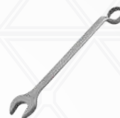
Chave combinada 46mm

Para fixação das braçadeiras nas treliças.