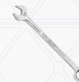
Chave combinada 2.1/4"

Para porca 1.1/2" do prisioneiro curto superior.